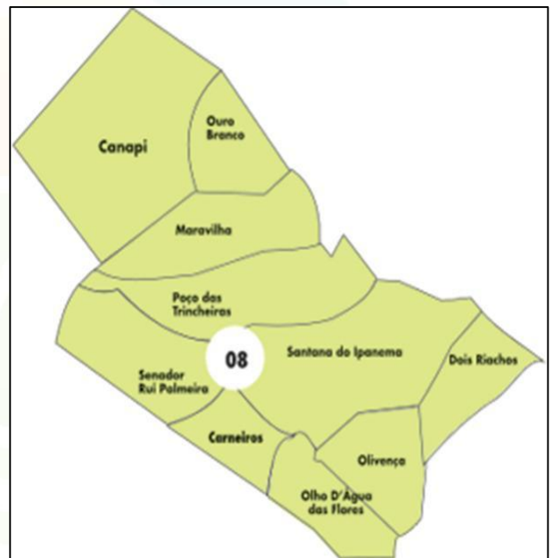
Figuras- 1/2 Mapa de Alagoas

Na década de 80, o cenário relacionado a área da saúde do município, era escasso, ou seja, todas as ações de saúde pertenciam ao município de Santana do Ipanema, onde o município ainda sem estruturação organizada era coordenado pela IV Região de Saúde.